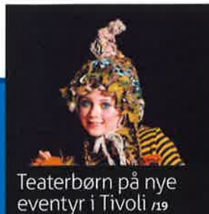
Teaterbørn på nye eventyr i Tivoli /19

Udvikling. Svømmehal i spil på Papirøen /14 Teater. Besparelsesplaner overrasker /16