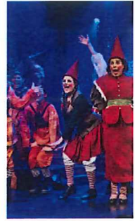
Nissepatruljen. Af Eventyrteatret, Glassal Tivoli, København.

Vi er enige om dommen: Seks ud af seks stjerner til Nissepatruljen for den knivskarpe koreografi, perfekte lyssætning og gåsehudsfræmkaldende sang, der spinder sig elegant og fuldstændig fejlfrit ind i hinanden.